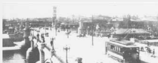
難波橋と大阪市電気鉄道