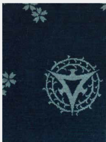
京都市電のシート地