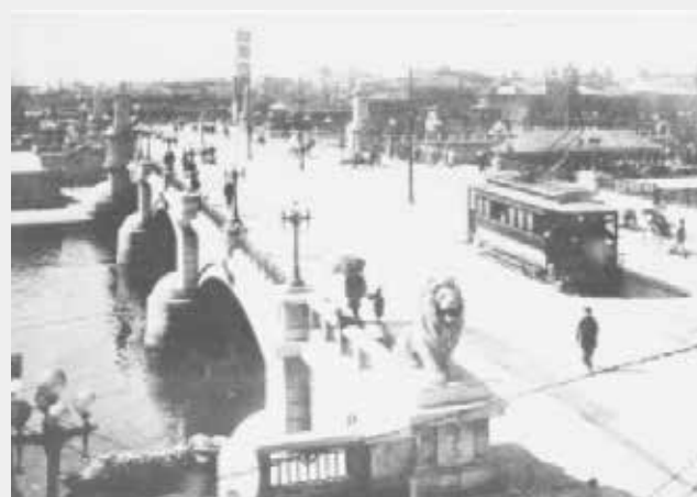
難波橋と大阪市電気鉄道