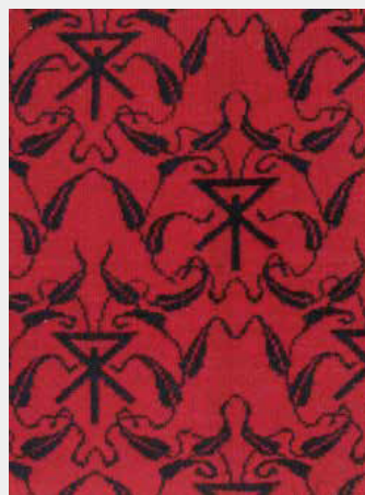
大阪市電のシート地